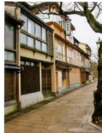
▲ひがし茶屋街はど人が多くない主計町だが、その静けさと雰囲気が出ている

主計町とひがし茶屋街は、城下町金沢を巡る上で外せないエリア。加賀百万石の伝統と文化が息づく茶屋街には旅の見どころが満載!