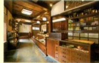
◀昔ながらの木造で情緒ある店内。天井の模様にも注目してみよう

加賀藩主前田家の料理人が創製した「加賀鮎」の伝統を継承する鮎専門店。併設する「茶寮不室屋」は、日本初の鮎料理の専門店だ。■9:30～18:30(茶寮は11:00～18:00)/無休(茶寮は火曜不定休) ☎076-224-2886