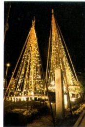
▲毎年10月末～2月末頃の期間中、武蔵ヶ辻交差点が光のイルミネーションで飾られる「金箔きらら」は冬の風物詩

古くから金沢の経済・交通の要所として栄え、東へ歩けば、神社やお堀、古い街並みが続く。趣深さを今なお残しつつ、モダンな店や建物も増えて古今融合の楽しみがあふれている。