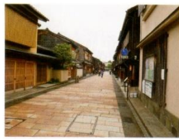
▲ひがし茶屋街は金沢で最大規模のお茶屋街として知られ、国指定の重要伝統的建造物群保存地区にもなっている