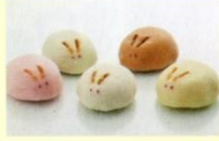
◀「銘菓 福うさぎ」は1個172円～

「銘菓 福うさぎ」は石川・金沢の名産品を素材とした餡を、ふんわり、もっちりとした生地で包み込んだ蒸し饅頭。五郎島金時、能登大納言、椿茶など五種類の味がある。■10:00～19:00/無休 ☎076-225-8200