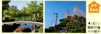
◀(左)シンボルの徽珍灯籠(右)雪吊りの様子

加賀藩の5代藩主前田綱紀以降、歴代藩主によって約180年かけて作庭された日本三名園の一つ。兼六園の名前の由来にもなっている景勝「六勝」は必見だ。兼六園のシンボルともいえる徽珍灯籠前は記念撮影にオススメ。