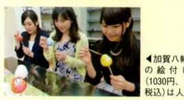
◀加賀八幡起上りの絵付体験(1030円、材料費・税込)は人気!

石川県内の老舗・有名店の銘菓や伝統工芸品などを集めた施設。和菓子手作り体験や砂彫りガラス体験なども。