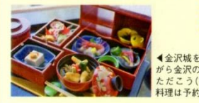
◀金沢城を眺めながら金沢の旬をいただく(写真の料理は予約限定)

1913年(大正2)創業の老舗茶屋。1階の売店では、地酒などのおみやげや名物の団子を販売。2階のレストランでは、金沢城を望む絶好のロケーションの中、金沢の旬の料理が味わえる。