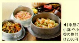
◀「季節の釜飯」は小鉢や小うどん、香の物付き。刺身は2080円(税別)

兼六園石川門前の名店。好みが選べる季節の釜飯(1480円~税別)のほか、富山湾・白海老が揚井や金澤カレー、食材にこだわったうどんも人気。