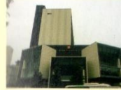
◀「武蔵ヶ辻」交差点でひときわ目を引くモダンな建物

美・食・健康・おもてなしをキーワードにした商業施設で、金沢を代表するギフト、スイーツショップやカフェ&レストランがラインナップ。■10:00～19:00(飲食フロアは～22:00)/無休 ☎076-225-8600(ル・キューブ金沢)